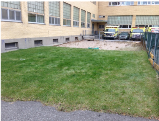
Ancienne cours de jeux du CPE à revitaliser.

Par la nature de ce projet, le Comité d'Action et de concertation en environnement (CACE) entend faire l'aménagement d'un potager collectif et d'un jardin mellifère en milieu urbain. Ce projet se veut une suite logique de notre projet d'apiculture initié en juin 2013 et correspond parfaitement aux valeurs du projet éducatif du Collège. En plus d'être innovant et stimulant pour la communauté, ce projet d'agriculture urbaine permet également de revitaliser nos espaces verts et de mettre en valeur notre serre éducative.