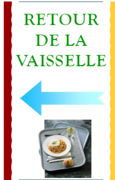
Un exemple d'affiche signalétique pour diriger les usagers vers la plonge