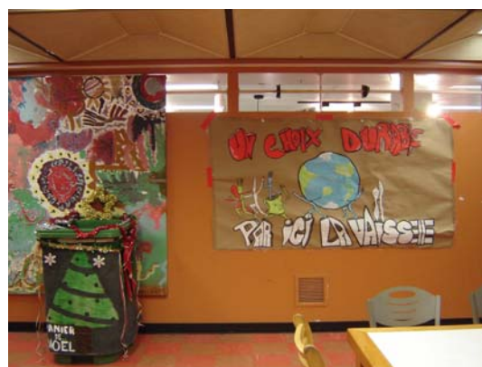
Affiche artistique réalisée par une étudiante du Cégep : l'affiche vise à capter l'attention, à diriger les usagers vers la plonge et à leur rappeler de rapporter leur vaisselle.